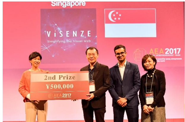
—準優勝 ViSenze (シンガポール)