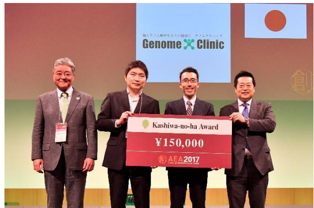
—柏の葉賞 ゲノムクリニック (日本)