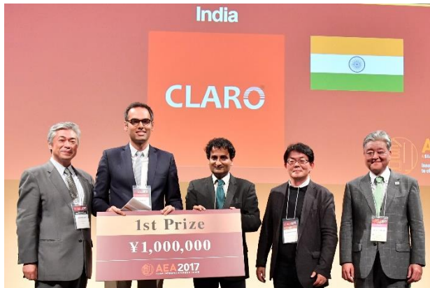
—優勝 Claro Energy (インド)