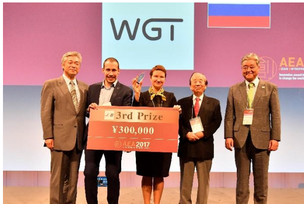
—第3位 Webgears WGT (ロシア)